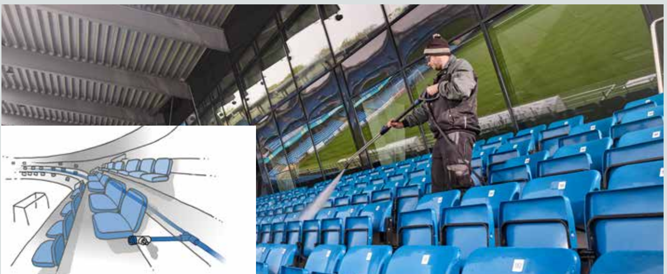
Reiniging van de openbare ruimtes en stoelen in het stadion. De reiniging van de openbare ruimtes na een wedstrijd of evenement kan een lastige klus zijn. In dit voorbeeld stelt het stationaire hogedrukreinigersysteem (SC DELTA) meerdere medewerkers tegelijk in staat om snel en efficiënt het schoonmaakwerk te verrichten