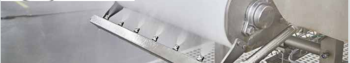
Transportbandreiniging in een groot slachthuis. In deze toepassing wordt de SC DELTA gevoed met het benodigde hete water en samen met de watercapaciteit en de druk die nodig zijn om het gewenste resultaat te bereiken. De SC DELTA maakt het mogelijk meerdere transportbanden tegelijk te reinigen