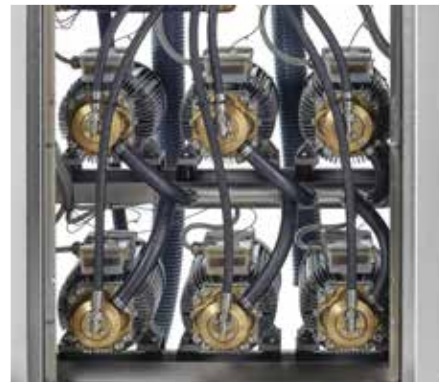
Gemakkelijke service en onderhoud Tijdsbesparende toegang tot motorpompen en andere vitale delen vanaf de bovenkant of voorzijde van de machine