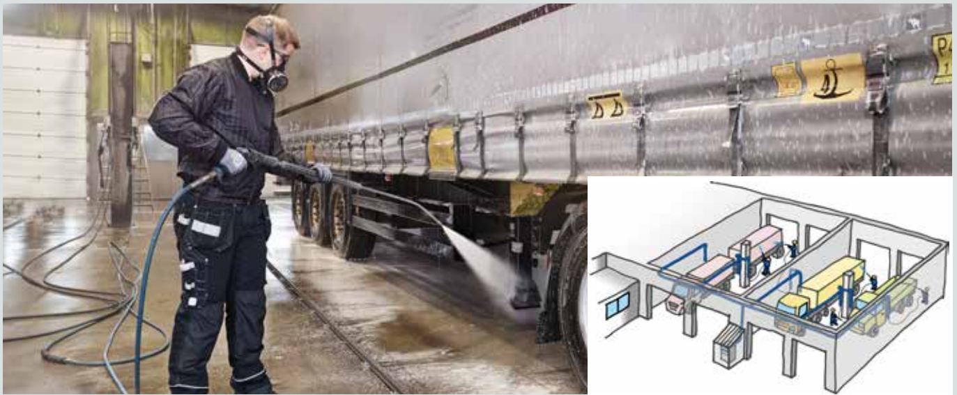
Wasstraat voor grote trucks. Belangrijkste toepassingen zijn het reinigen van trucks, voorwas & reiniging van moeilijk te bereiken plekken en de reiniging van de binnenkant van trailers. Dit bedrijf beschikt over 4 wasposities waar tot max. 6 werknemers tegelijk aan het werk zijn.