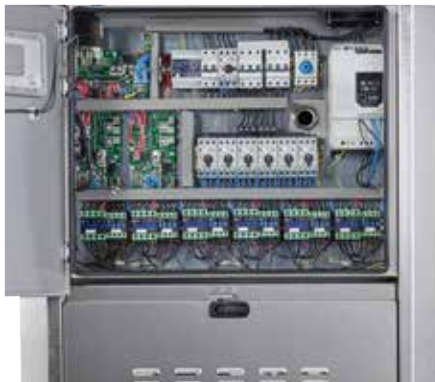
Handig en comfortabel: geavanceerd pompmanagementsysteem met start/stop-regeling