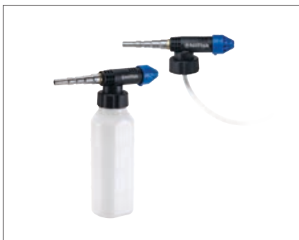
De FoamSprayer -technologie maakt een eenvoudige en efficiënte toepassing van het reinigingsmiddel mogelijk.