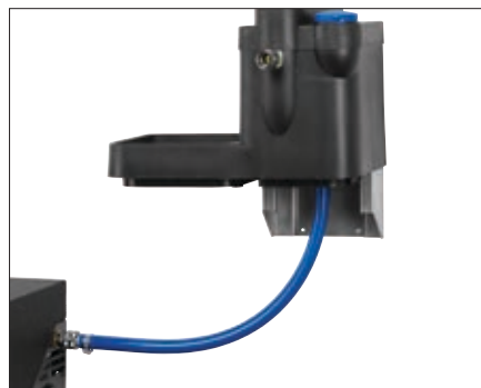
Externe vlotterbak met terugslagklep tot 40 l/min.