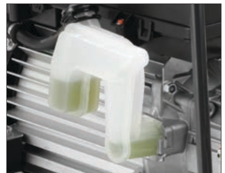
Pompolietank met zichtindicator en vul/legen functie.