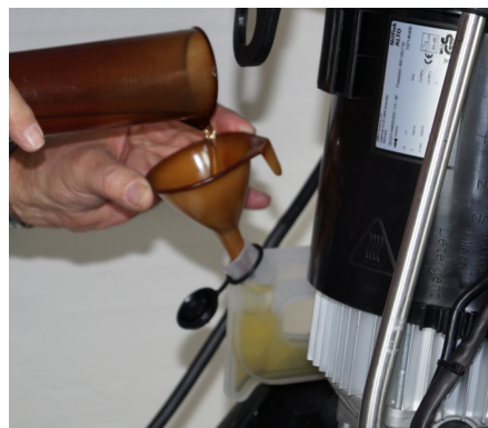
Pompolietaank met oliepeilglas en vullen/leggen functie.

Sommige machines in de MC 3C-reeks bevatten de FoamSprayer-technologie, die een eenvoudige en efficiënte toepassing van schoonmaakmiddelen mogelijk maakt. Indien niet meegeleverd, kan dit als apart accessoire worden aangeschaft.