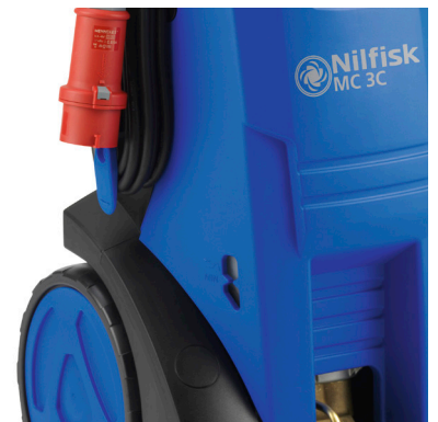
De draaibare kabelhaak maakt kinderspel van het op- en afrollen van het elektrische snoer.