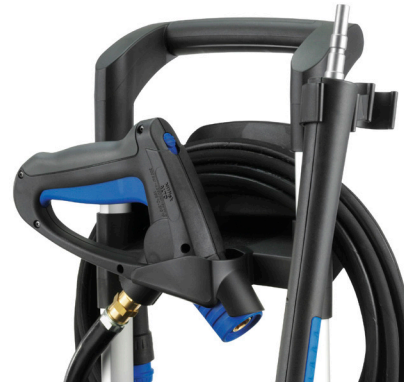
Unieke gepatenteerde spraypistool houder beschermt het spraypistool tegen vallen op de grond.

De MC 3C is ontworpen voor lichte algemene schoonmaaktaken en is de ideale keuze voor lichte industrie, automotive en agri.