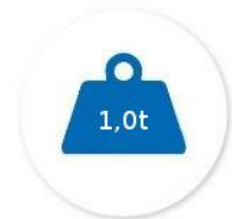
Tragfähigkeit max. 1,0 t