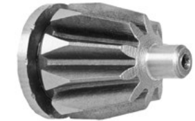
Für Typ • For Type 3105, 3200, 3600, 4500, 4600, 4700, 4800, 35**, 37**, 38**, 3295