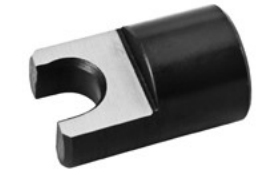
Für Typ • For Type 43**