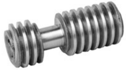
Für Typ • For Type 43**