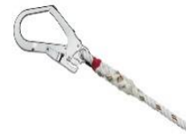
Abb.: Tyger 3 mit Haken MAS 51